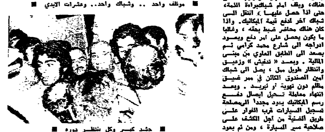
موظف واحد .. وشباك واحد .. ومشرات الأيدي

طرابلس - من مكتب (الأخبار) : قصة أهالي الشمال مع دفع رسوم ميكانيك السيارات محزنة وطريفة في نفس الوقت ، حيث يضطرون لقطع حوالي مليوني كيلومتر كل عام في سبيل دفع الرسوم المترتبة عليهم ، وهم يأبوا طويلاً من اللق والدوران وراء الامتيازات الروتينية .